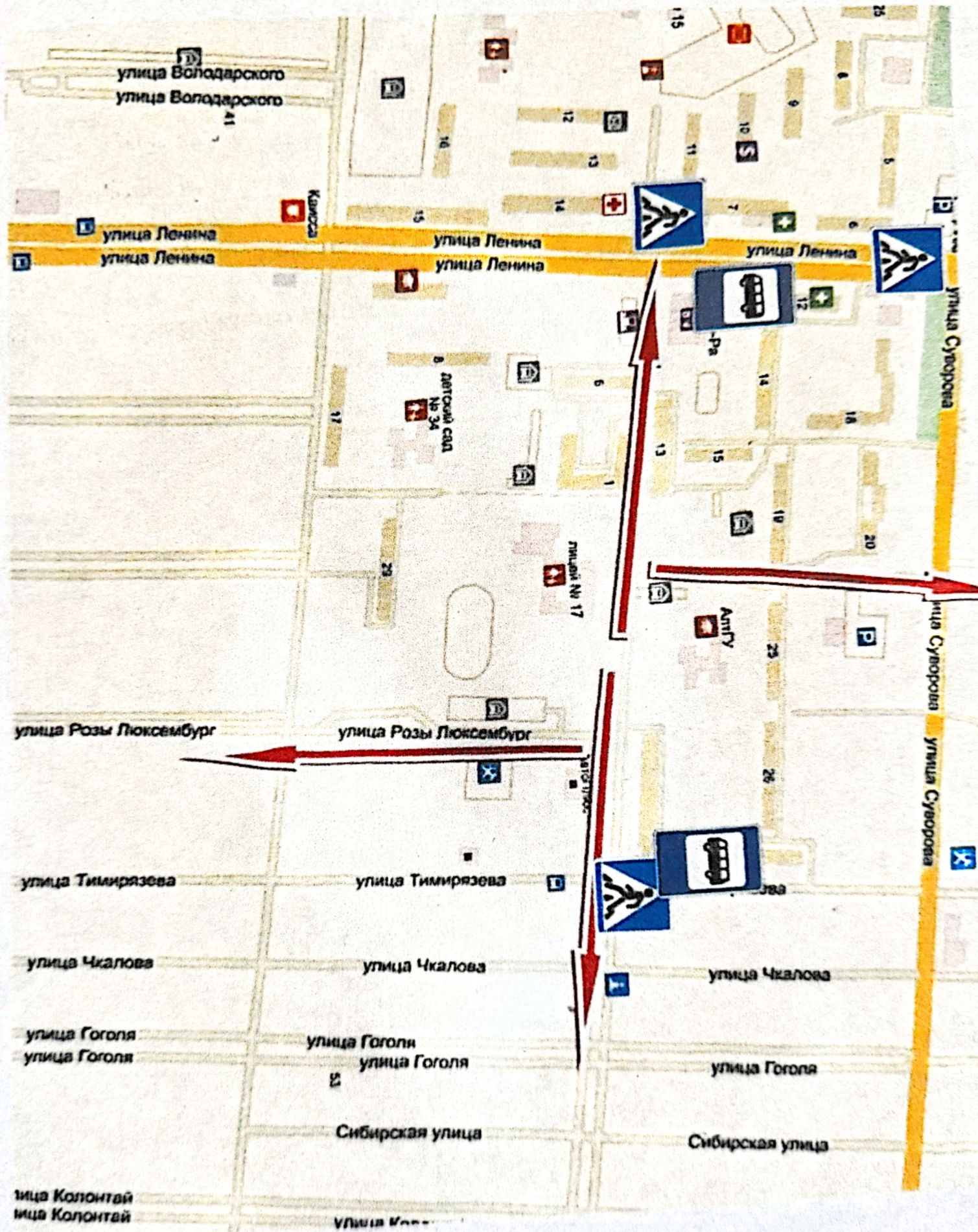
Схема района расположения МБОУ «Лицей №17», пути движения транспортных средств и учеников